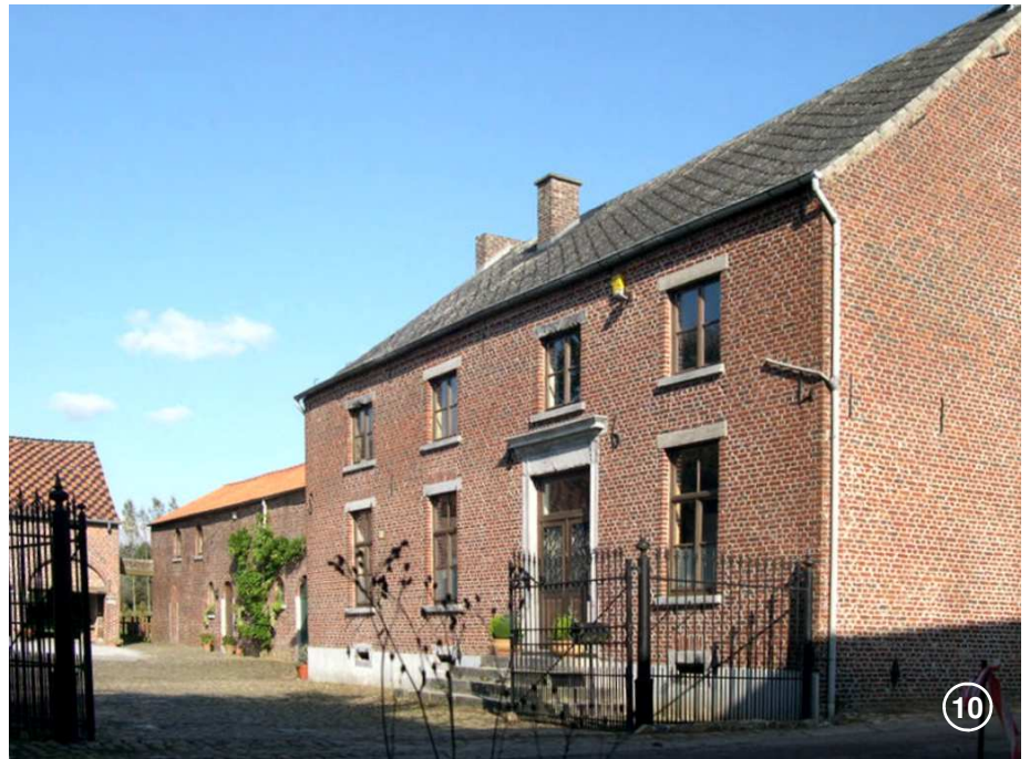
En bordure de l'Orne, la demeure de 1864 du propriétaire de l'ancienne brasserie de Noirmont domine une cour pavée autour de laquelle subsistent certains bâtiments d'exploitation.

Après 100 ou 25 mètres, c'est selon, engagez-vous à droite dans la petite boucle de la rue du Bief. Elle vous permet de passer devant l'ancien « moulin de Cortil » ⑦, qui porte ce nom, malgré son implantation à Noirmont, à la suite d'un échange de terrains entre les deux villages conclu au XVIII e siècle. Les bâtiments du moulin actuel datent de 1865. L'aile gauche, ancienne étable, est du XVIII e siècle. L'aile droite est l'ancienne habitation du meunier. Ces deux ailes sont devenues des résidences particulières.