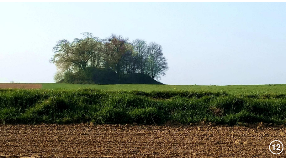
Les tumuli jumelés du III e siècle de Noirmont font partie du patrimoine exceptionnel de Wallonie.

Vous ne voulez pas de l'escalier ? Contournez alors l'église au bout de la rue par la très roulante N 273. Sinon, vous trouverez la N 273 à la sortie du parking qui jouxte l'église. Quoi qu'il en soit, prenez cette rue