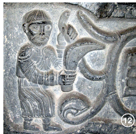
Un ouvrier taillant une vigne, sculpture des fonts baptismaux du XII e siècle à Gentinnes