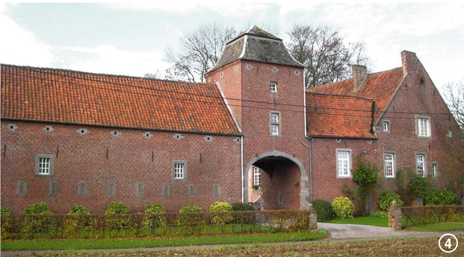
Le Ferme de la Grande Bierwart date du XVIII e siècle. Elle est classée.

Après ce moment suspendu, retrouvez et poursuivez votre chemin dans le bois. À sa sortie, après un pont sur la Houssière, vous contournez l'ancienne ferme du château et trouverez à droite l'entrée du domaine de Kongolo. Allez-y. Face à