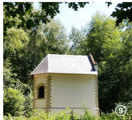
La chapelle de l'Ermitage du XVII e siècle, située entre une bêtraie cathédrale et une réserve naturelle de la Wallonie.

Dos à l'église, vous repartirez ensuite à gauche en empruntant la rue du Pont d'Arcole. Vous passerez un pont sur la Houssière, encore elle.